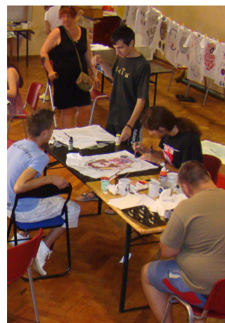
Deset dana kreativnih radionica

snimali filmove i na kraju pred punom salom lokalnog kina prikazali svoja kratka četiri angažirana filma o buci, upotrebi plastičnih vrećica, napuštanju životinja i ravnopravnosti spolova kroz prizmu zanimanja.