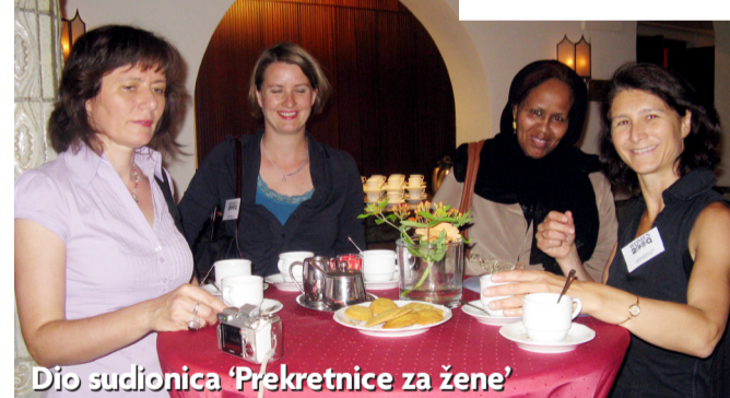
Đio sudionica 'Prekretnice za žene'