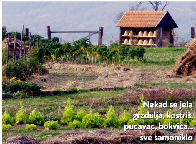
Nekad se jela grzdulja, kostriš, pucavac, bokvica... sve samoniklo

- Riječ je o osnovnoškolcima koji su članovi udruge, a koji su dobili zadatak da od svojih