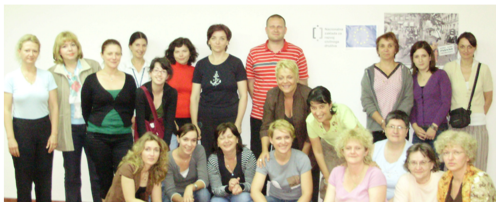
Aktivisti Ženske sobe pružaju direktnu i indirektnu pomoć i podršku žrtvama seksualnog nasilja

- Istraživanjem smo željeli dobiti uvid u područja i oblike rada organizacija, kapacitete, educiranost kao i doprinose koje one daju u području suzbijanja nasilja protiv žena. U startu smo na popisu imali više od 80 organizacija, no nakon što smo postavili kriterije da organizacije moraju raditi dulje od dvije godine, imati najmanje 10 savjetovanja mjesečno, te da nisu crkvene ili političke organizacije, došli smo do brojke od 32 organizacije koje pružaju direktnu pomoć ženama žrtvama nasilja, ističe