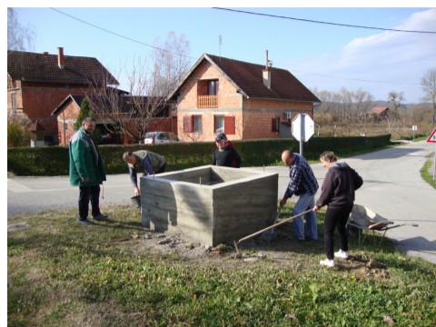
Branitelji izvode radove koji će promijeniti izgled središta

TRADICIJA LIPE Pokraj bunara se nalazi mlada lipa što su je mještani sela posadili 2007. na mjestu stare stogodišnje lipe koja se osušila nakon Domovinskog rata.