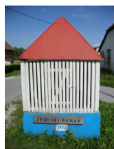
Stari školski bunar bio je veselo obojan, ali dotrajavao i opasan

“Školski bunar” posljednji je put obnovljen 1925. i godinama su ga koristila djeca jer se nalazi u blizini Stare škole. No, zub vremena ga je ošteti. Temelj je napukao, a gornji drveni dio i krov su se nakrivili, pa više nije siguran za korištenje. Osim toga, kako u Graboštanima ne postoji