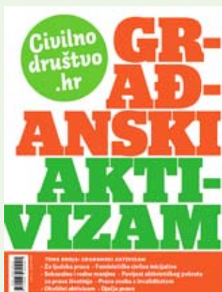
CIVILNO DRUŠTVO.HR, JESEN 2007.