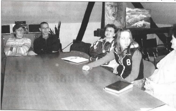
Belomanastirci, iako ih je bilo malo, pozorno su pratili izlaganje projekta

Danas je jako malo volontera i dosadašnja praksa pokazuje