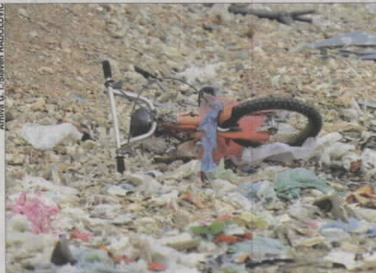
Prema najavama, u Europi bi korištenje plastičnih vrećica trebalo biti zabranjeno do 2010. godine

plastičnim vrećicama. Druga razina aktivnosti predviđa pak uključivanje u kampanju poslovnog sektora, odnosno trgovina.